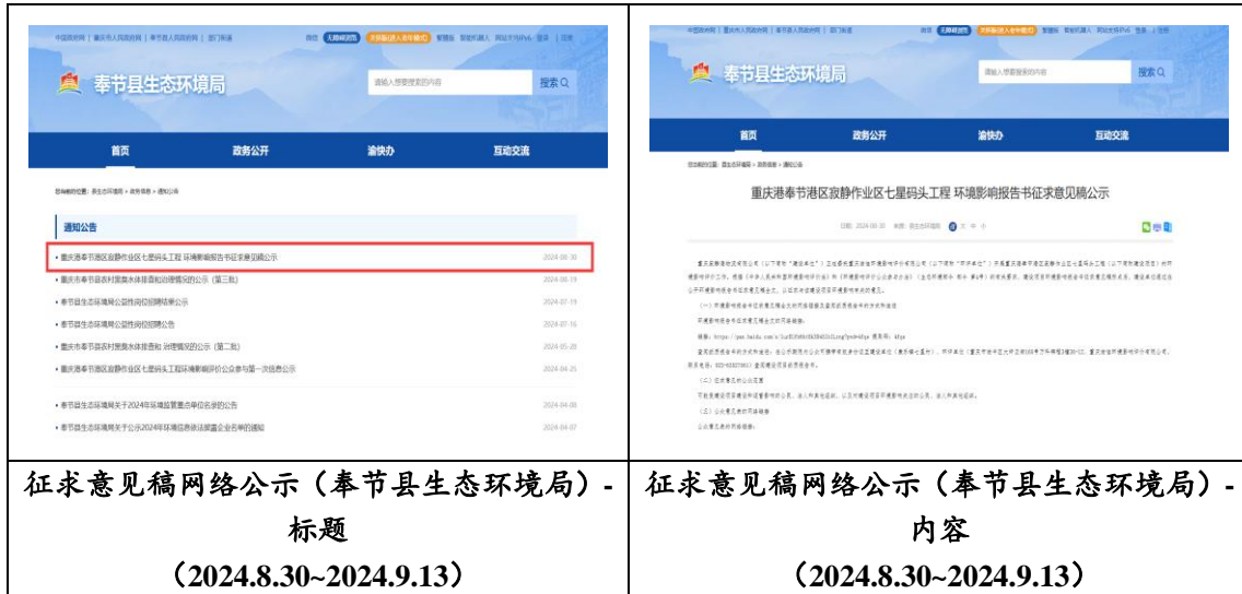
图 3.2-1 征求意见稿网络公示