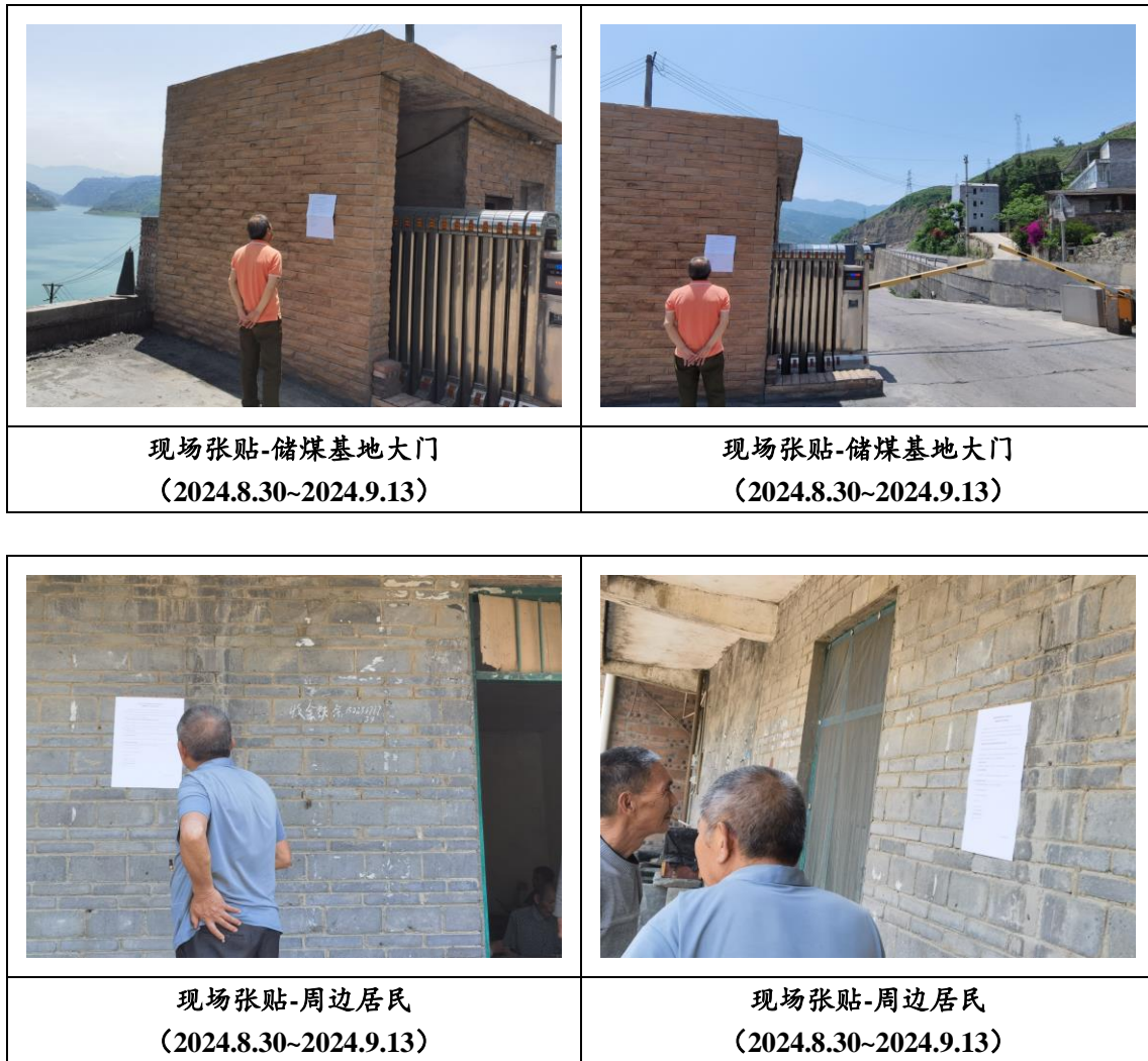
图 3.2-5 征求意见稿现场张贴公示