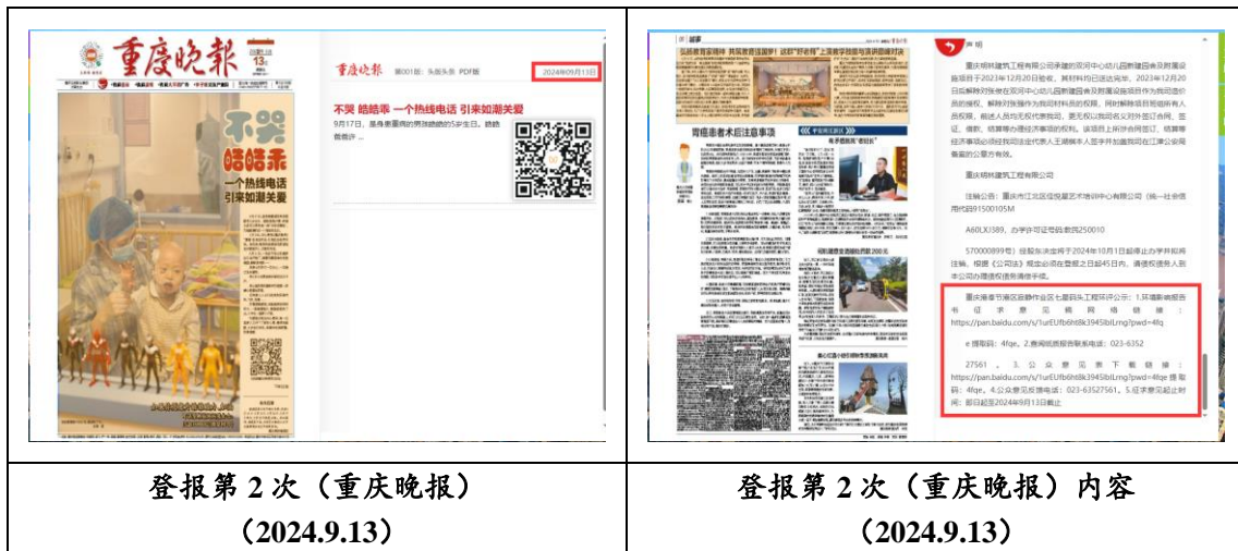
图 3.2-3 征求意见稿报纸登报公示（第二次）