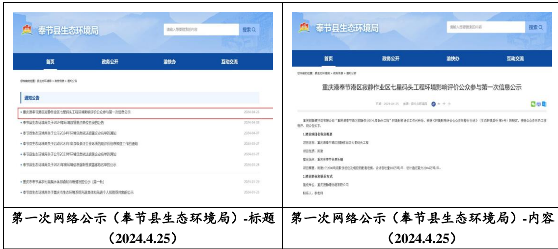
图 2.2-2 首次环境影响评价信息公开（网络公示）