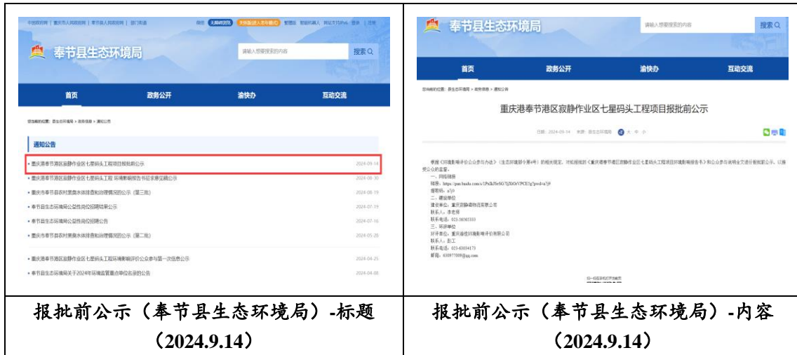
图 6.2-1 报批前公开（网络公示）